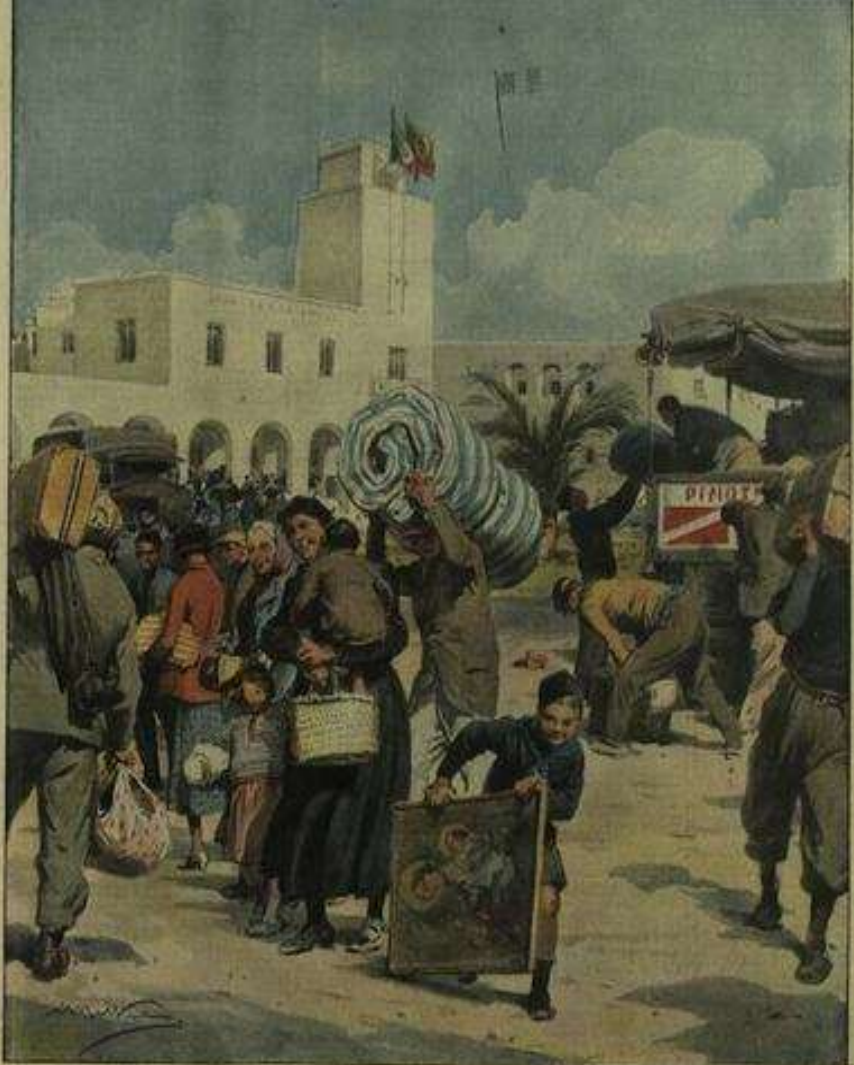
I nuovi coloni della Quarta Sponda. Il festoso arrivo di un gruppo di coltivatori italiani in uno dei nuovissimi paesi sorti in Libia; una casa con tutte le comodità e un vasto campo attendono le laboriose famiglie. (Disegno di A. Bellavere)

Anno 40 - N. 47 13-19 Novembre 1938 - XVII Centesimi 40 la copia